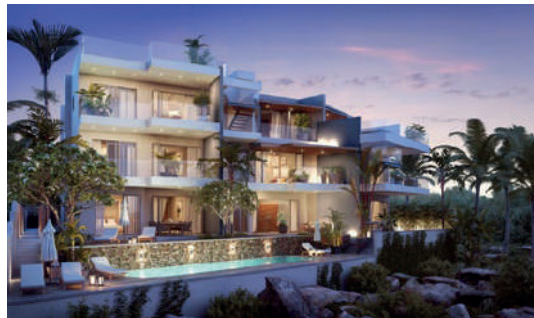
Ocean's Garden 2