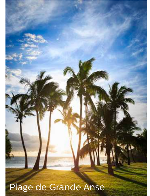
Plage de Grande Anse