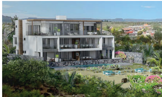
Ocean's Garden FLIC EN FLAC