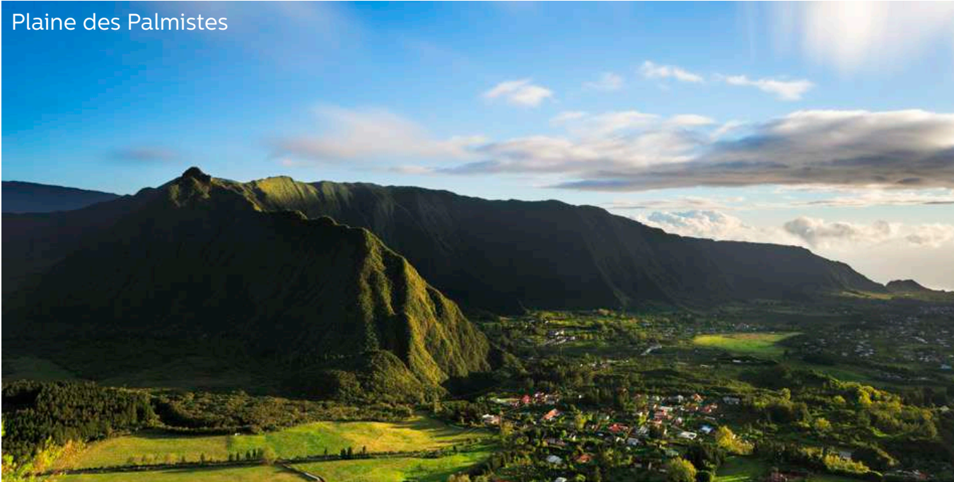
Plaine des Palmistes